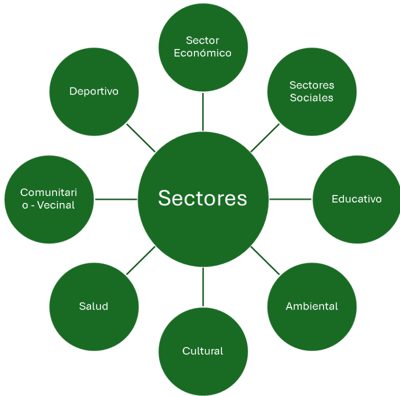
Gráfica 3. Participación Organizaciones de la Sociedad civil